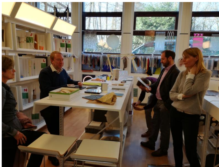
Visita de la biblioteca de materiales Materio.be Belgium

Esta guía pretende facilitar a los centros de Formación Profesional información sobre cómo establecer un sistema de vigilancia entre profesores y alumnos que se mantenga en el tiempo, y cómo realizar una búsqueda estructurada y sistematizada de materiales innovadores, materiales sobre los que actualmente no se forma a los alumnos en su uso y manejo durante el proceso educativo, o bien materiales que provienen de otros sectores productivos y que podrían ser utilizados en el sector del mueble.