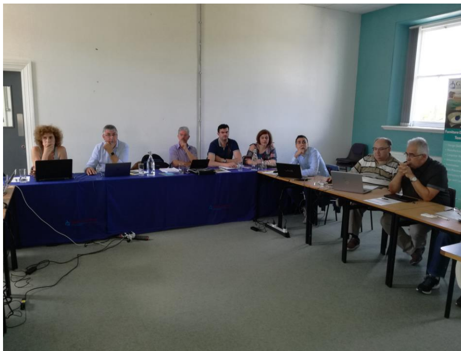
Tercera reunión de proyecto en GMIT Letterfrack

Esta búsqueda y selección ha dado lugar a un número elevado de materiales innovadores, que han sido evaluados por cada uno de los socios desde el punto de vista de implementación/conocimiento en su país, y tras esta evaluación, se han seleccionado 123 materiales innovadores, descritos cada uno de ellos en una.